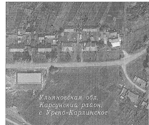
Ульяновская обл, Карсунский район, с. Урено-Карлинское