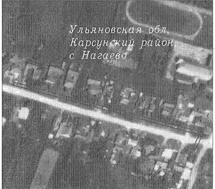
Ульяновская обл. Карсунский район с. Нагаево