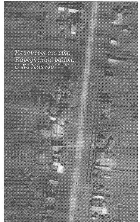
Ульяновская обл, Карсунский район, с. Кадышево