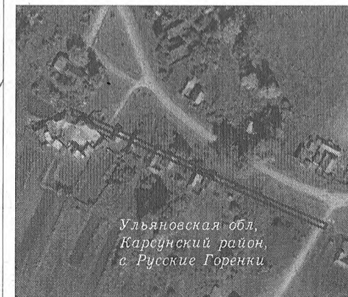
Ульяновская обл, Карсунский район, с. Русские Горенки