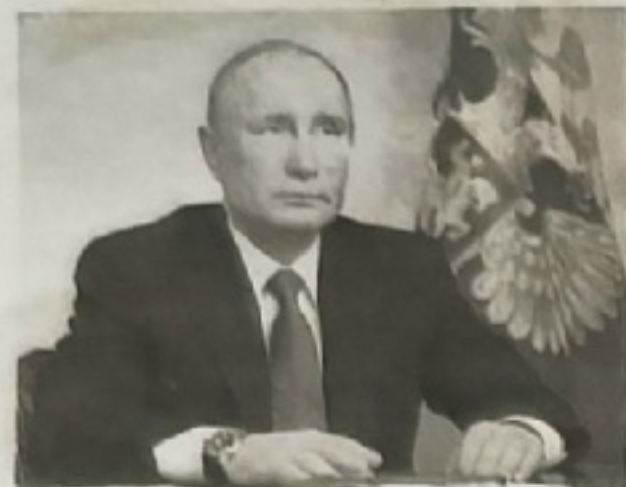
Совещание по вопросам образования

Президент провёл совещание по вопросам образования с Заместителем Председателя Правительства Дмитрием Чернышенко, Министром просвещения Сергеем Кравцовым и Министром науки и высшего образования Валерием Фальковым. Рассматривались вопросы развития образовательной инфраструктуры, результаты проведения ОГЭ и ЕГЭ, проведение приёмной кампании в вузах и колледжах. В завершение встречи Президент проинформировал о ситуации в сфере туризма и проведении летнего сезона, в том числе в разрезе студенческого, научного и образовательного туризма.